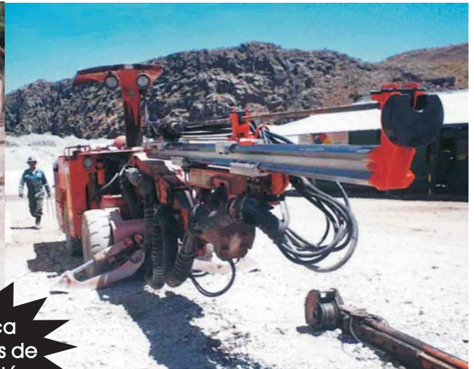
Mercury Jumbo with RE-2000 Series Feed