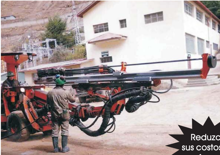
Quasar Jumbo with RE-2000 Series Feed