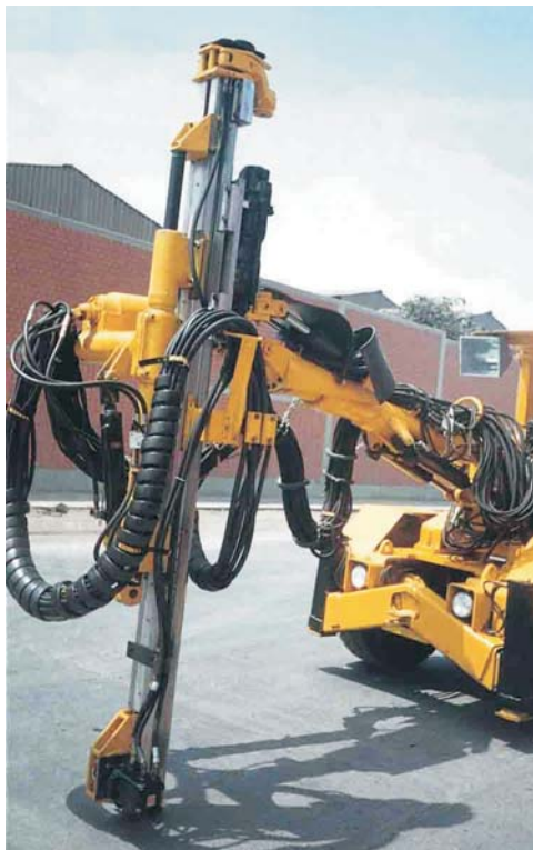
Long Hole Feed on Atlas Copco Jumbo